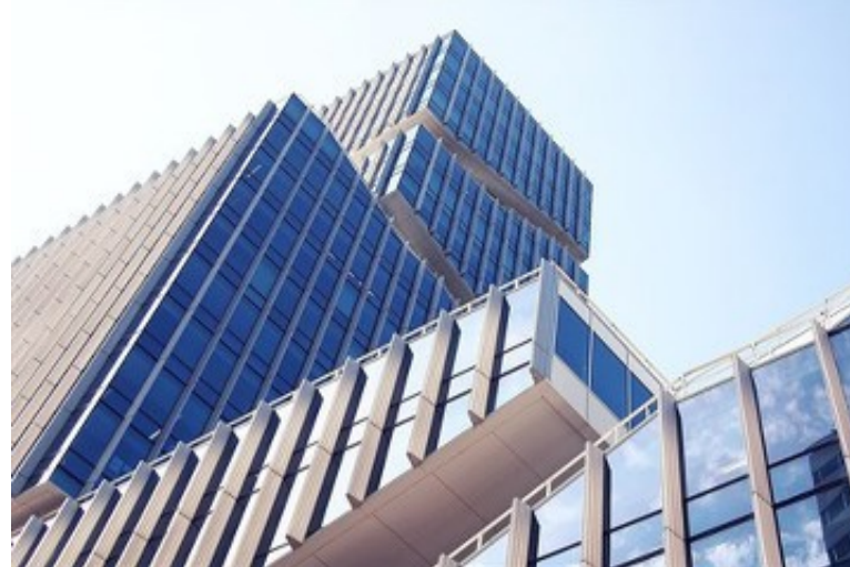
Stora Kontorsdagen 📅 2021-03-24