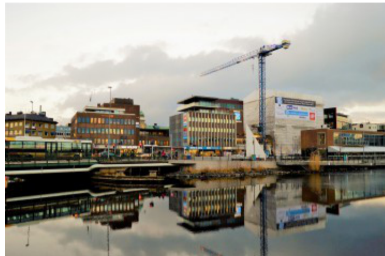
Fastighetsmarknadsdagen Jönköping 📅 2021-03-31